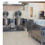
Podlahy v kuchyni