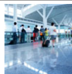
Podlahy ve firmách